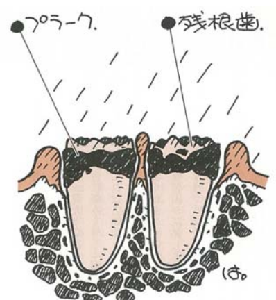
※磨きにくく、食べかすがたまりやすい!!

処置については、患者のお体や口腔内、また残根の数や根の状態などによってその方法は異なり、歯周病の進行や、残根歯が揺れて痛みがある場合は抜歯を行うことが多いです。この場合、麻酔使用や、切開による出血もあることから、お体への負担を十分考慮する必要があります。