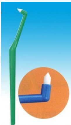
【ワンタフトブラシ】 ご注文を承っています お問い合わせ下さい

また、当院では「 ワンタフトブラシ 」を勧めています。腹の部分の毛束をカットした形体となつているためより深く差し込む事が可能で細い毛束が確実にフィットさせしつかりと磨くことができます。