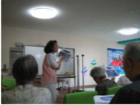
皆さん説明より配布した口腔ケア資料に夢中のご様子でした。一緒にお配りした歯ブラシを嬉し