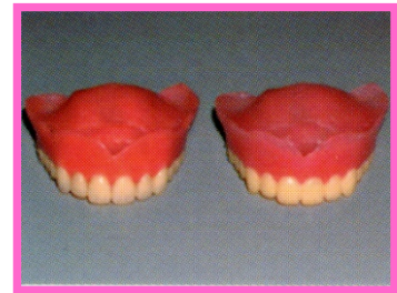
[ 完成 ]

・歯(白)と床(ピンク)の境目の曲線が再現され難い。 ・元の入れ歯との微妙なズレがある。そのまま使用すると痛みをとまなうため大抵作製後にクッション材を敷きます。