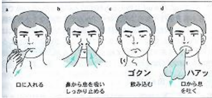
「嚥下障害ポケットマニュアル / 聖隷三方原病院嚥下チーム」より引用

水分を口に含む 鼻から息を吸い しっかりと止める 飲み込む 息を「はっ」と 吐く